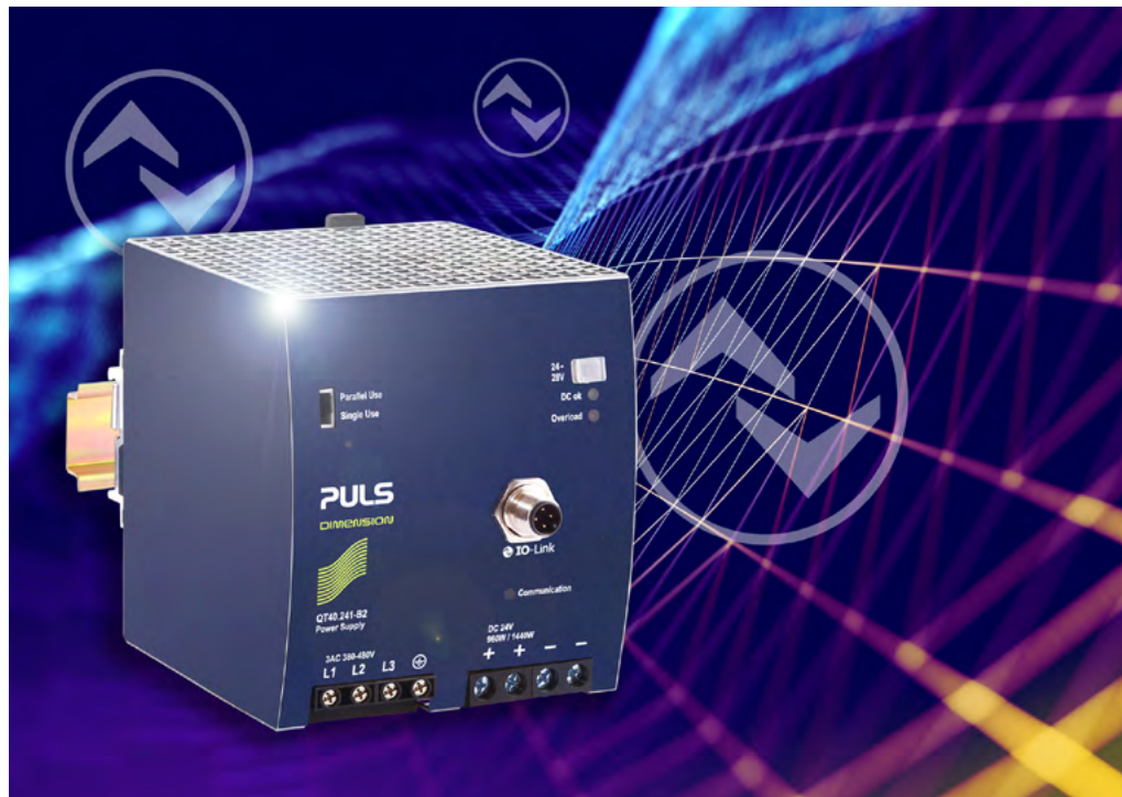
Das QT40.241-B2 liefert neben einer zuverlässigen Spannungsversorgung auch wertvolle Daten über IO-Link.

Die Stromversorgung sitzt an einem zentralen Knotenpunkt im System. Hier fließt mehr als nur Strom. Ein Netzgerät erfasst zahlreiche Echtzeitinformationen, die für den Betreiber und auch den Hersteller der Anlage äußerst interessant sind. Wie hoch sind Ausgangsstrom und Ausgangsspannung? Wie lange ist die verbleibende Lebensdauer des Geräts? Wie entwickelt sich die Temperatur in der Anwendung? Wie stark ist das Netzteil ausgelastet? Wie steht es um die Qualität der Netzspannung?